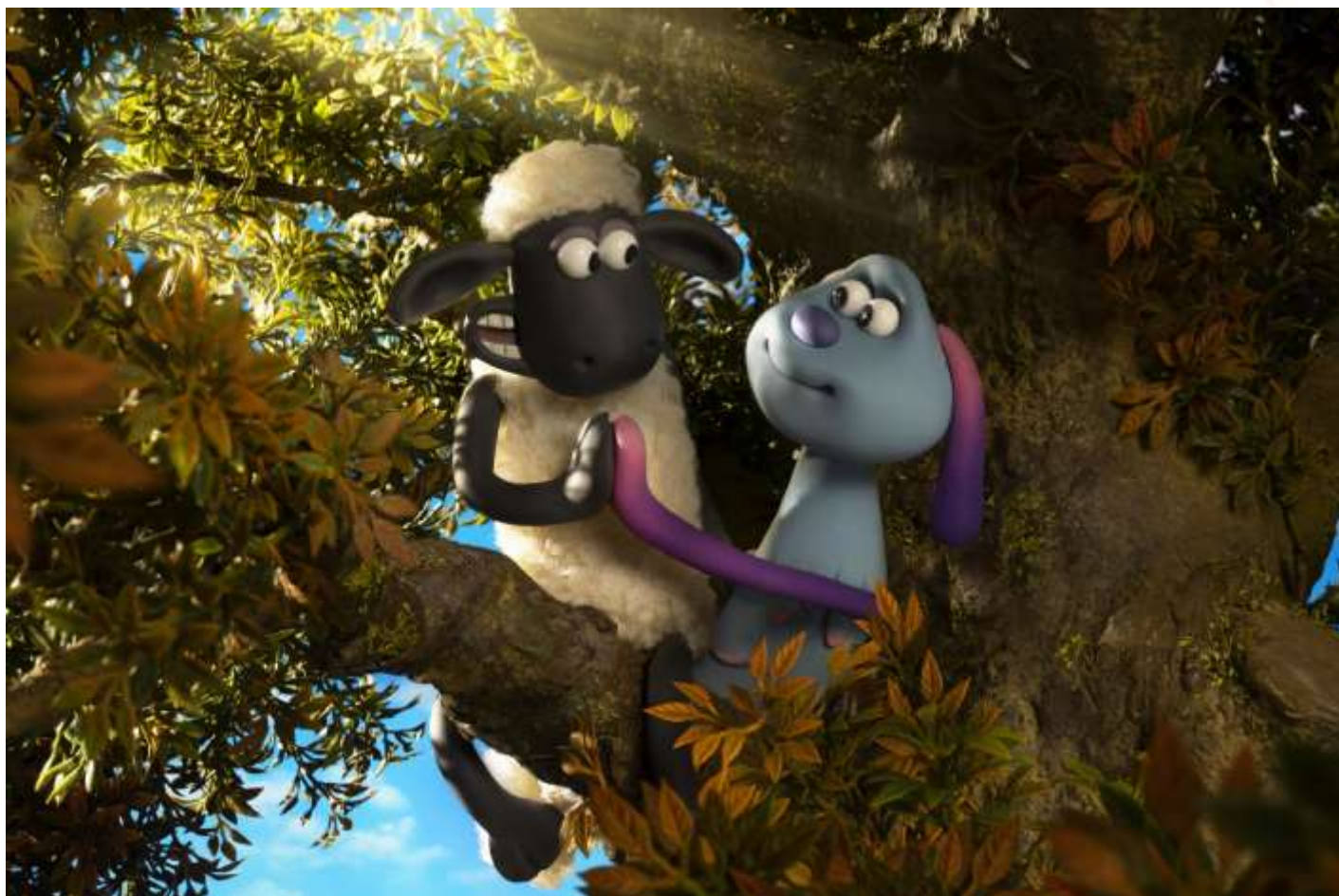
© Shaun das Schaf – UFO Alarm, StudioCanal, 2019

2015 übertrug der erste Spielfilm zur knetanimierten Fernsehserie „Shaun, das Schaf“ den Charme der Vorlage mit Erfolg auf die Kinoleinwand. Im zweiten Film, der die drolligen Bauernhoftiere mit einer außerirdischen Besucherin zusammenbringt, gelingt das Kunststück erneut. Diesmal zitieren die Animator*innen der britischen Aardman Studios einige Klassiker des Science-Fiction-Genres, was den Film ohne Sprache auch für ein älteres Publikum sehenswert macht.