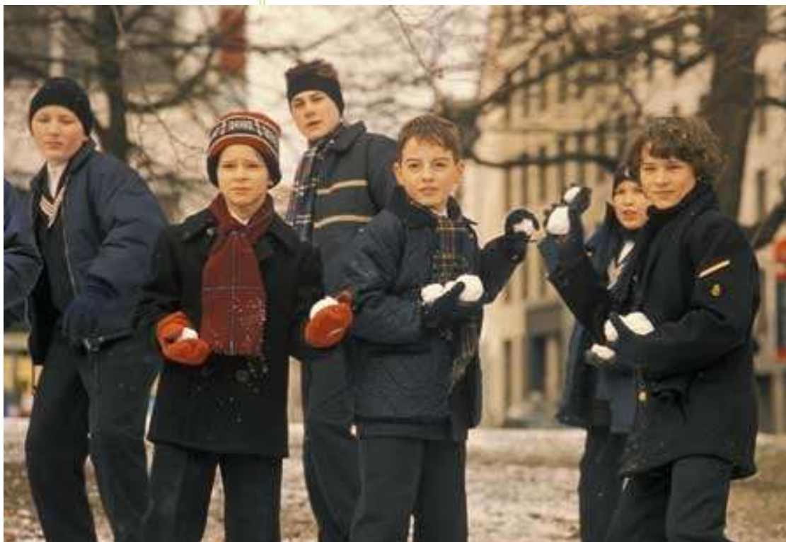
© Das fliegende Klassenzimmer, Constantin Film, 2002

Die Tertianer eines Leipziger Internats und die "Externen" Klassenkameraden aus Leipzig mögen sich nicht besonders. Die Tertianer, das sind Martin, Uli, Matz, Kreuzkamm junior und Jonathan, der bereits von acht Internaten geflogen ist, bevor er von der Schule des berühmten Thomanerchors in Leipzig aufgenommen wird. Jonathan ist auch jetzt wenig zuversichtlich, dass er es diesmal schaffen wird. Der Internatsleiter Justus ist aber anderer Ansicht und behält Recht: Die Klassenkameraden nehmen ihn in ihrem Kreis auf und zeigen ihm sogar ihren Geheimtreff: einen alten Eisenbahnwaggon auf einem Brachgrundstück. Dort werden sie von einem seltsamen Mann, dem "Nichtraucher" überrascht, der ebenfalls einen Schlüssel zu dem Waggon besitzt. Am nächsten Morgen ist in der Nikolaikirche eine Konzertaufzeichnung des Internatschors anberaumt. Die "Externen" stehlen die Konzertnoten und entführen Kreuzkamm, weshalb der Auftritt eine Katastrophe wird. Wiedergutmachen wollen die Freunde das Fiasko durch eine gelungene Weihnachtsaufführung des Theaterstückes "Das Fliegende Klassenzimmer", dessen Script sie in Ihrem Eisenbahnwaggon gefunden haben. Mit ihren zunächst heimlichen Proben lösen sie eine Reihe von Ereignissen aus, die zunächst Verwirrung und schließlich aber eine umfassende Versöhnung stiften.