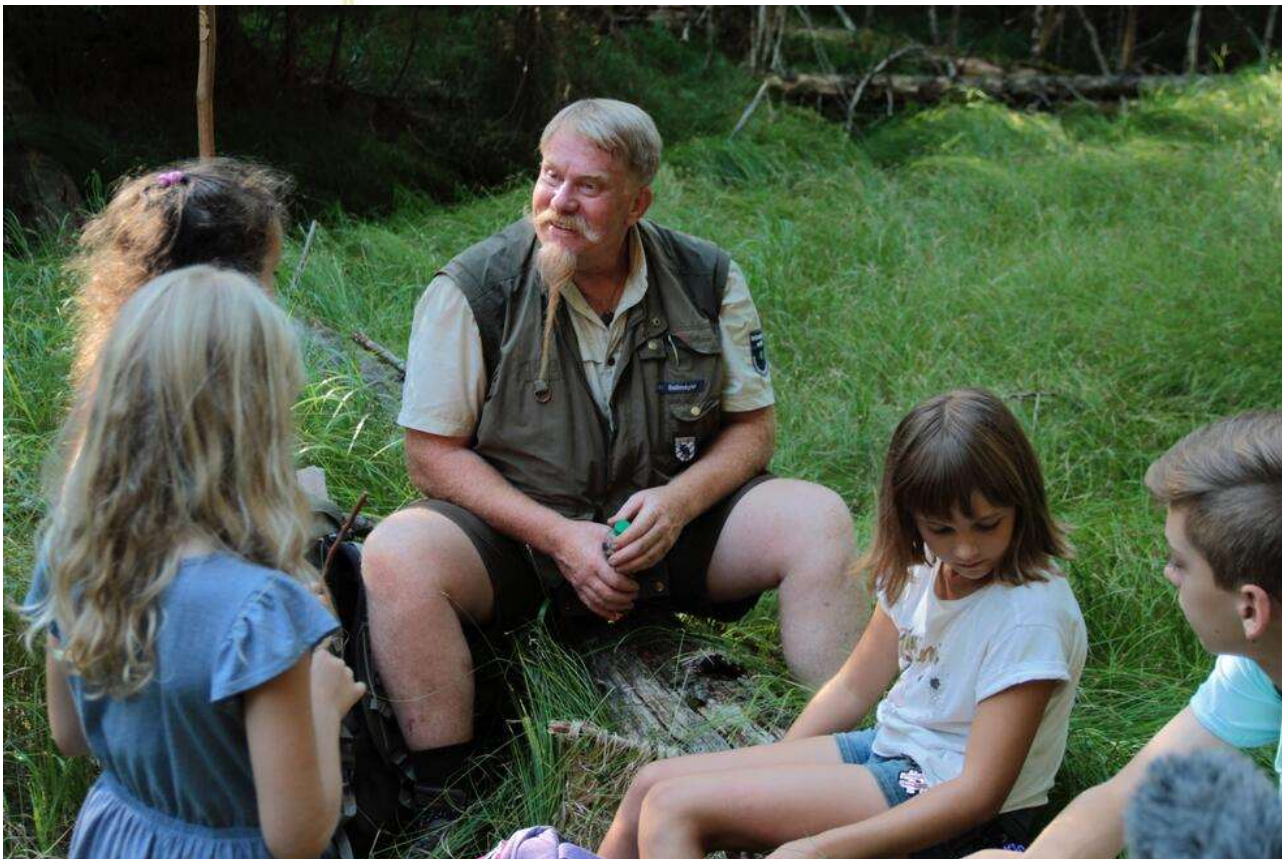
© Lene und die Geister des Waldes, Real Fiction, 2021

Die siebenjährige Lene soll ihre Sommerferien ausgerechnet im Bayerischen Wald verbringen! Ihr Papa will die Natur malen und die beiden Töchter müssen mit. Widerwillig erkundet sie die Gegend und muss feststellen, dass die Kinder rund um ihre Ferienpension zwar seltsam sprechen, man aber jede Menge Abenteuer mit ihnen erleben kann. Auf Streifzügen durch den Wald begegnet sie dem urigen Waldobelix und lernt die Legende des verschwundenen Waldpeters kennen, der nun in der „Grotte der schlafenden Seelen“ auf seine Erlösung wartet. Sie redet mit Kühen und Eseln, Wachteln und Käfern und stellt fest, wie faszinierend es ist, sich frischen Honig direkt von den Bienen abzuholen. Als sich das Ende der Ferien nähert, hat sich ihr Blick auf den Bayerischen Wald, aber auch auf die Welt an sich gründlich verändert.